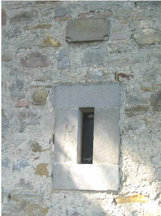
ZONA 1 Foto n. 21: Chiesa di S. Giorgio, particolare di una finestra