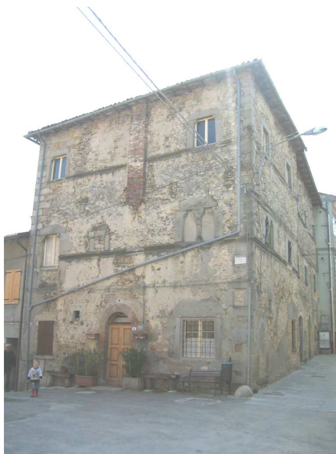
ZONA 1 Foto n. 77: Domus Communis Fregnani, vista d'insieme