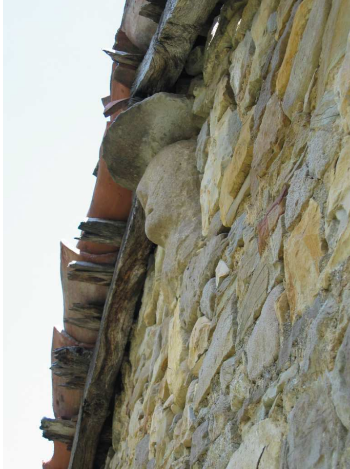
ZONA 1 Foto n. 92: Maschera scolpita a tutto tondo, vista dal basso