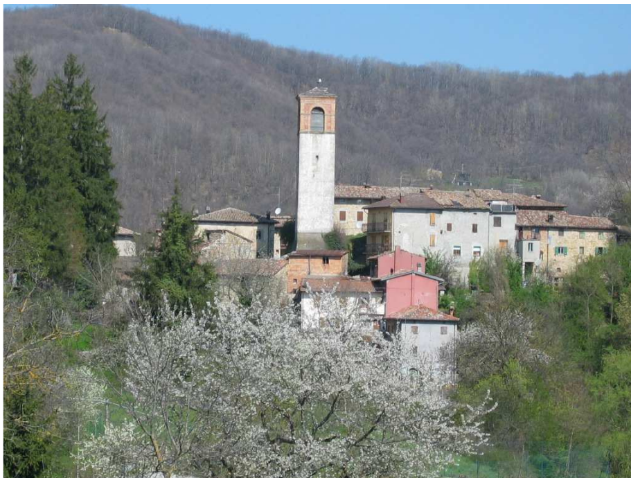
Castello di Monzone, veduta d'assieme