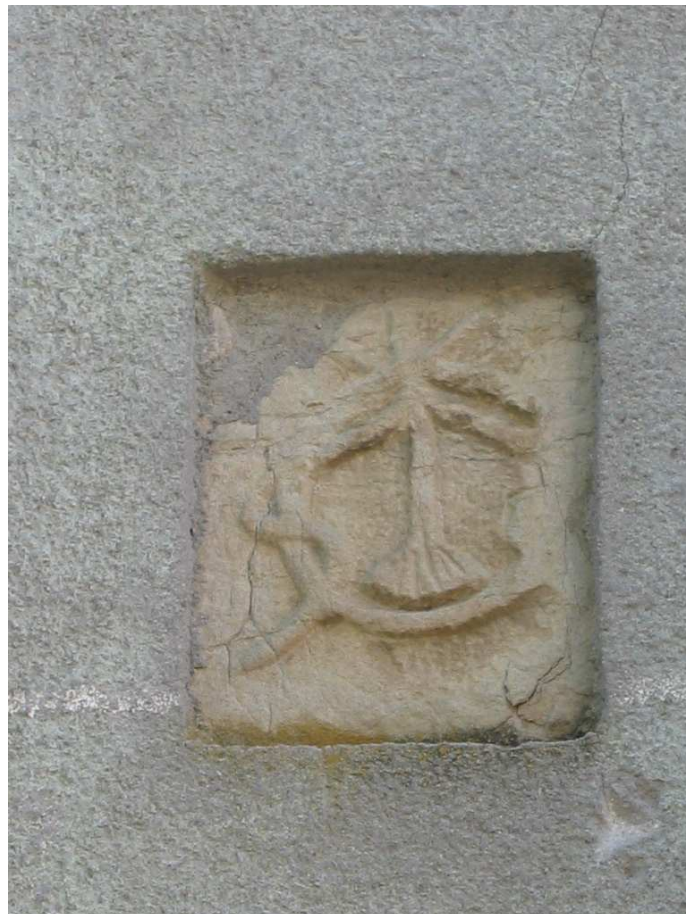
ZONA 2 Foto A: Stemma dei Frassoni murato all'esterno della canonica