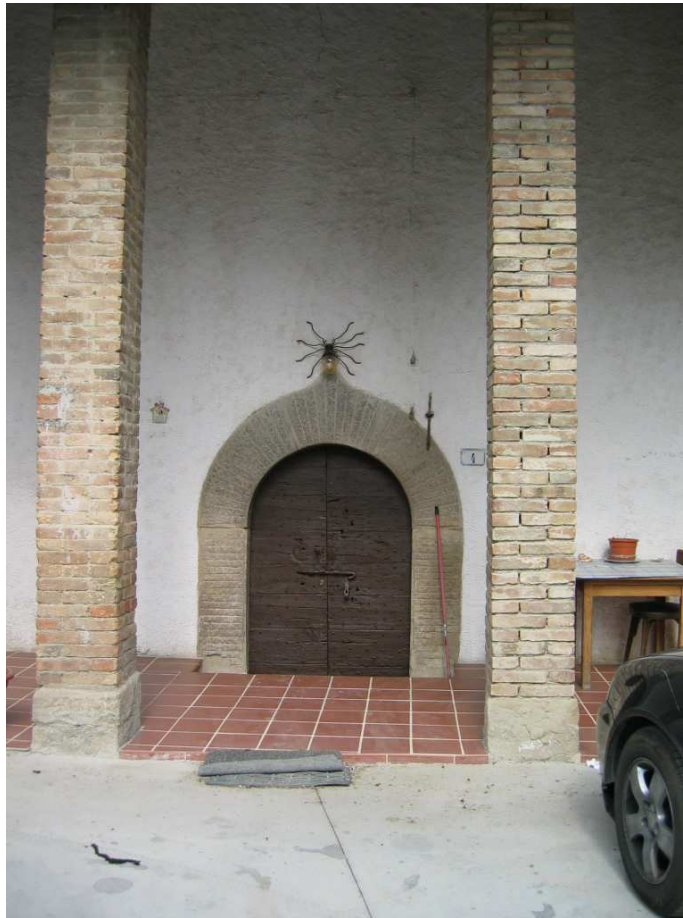
ZONA 2 Foto n. 36: Portale ad arco con chiave sagomata a cuspid