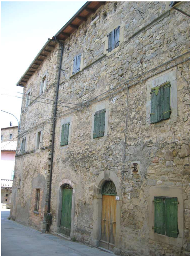
ZONA 1 Foto n. 27: Domus Communis Fregnani, fianco