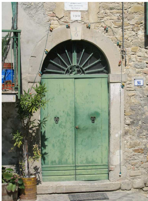
ZONA 1 Foto n. 63: Portale di un edificio nella zona del castello