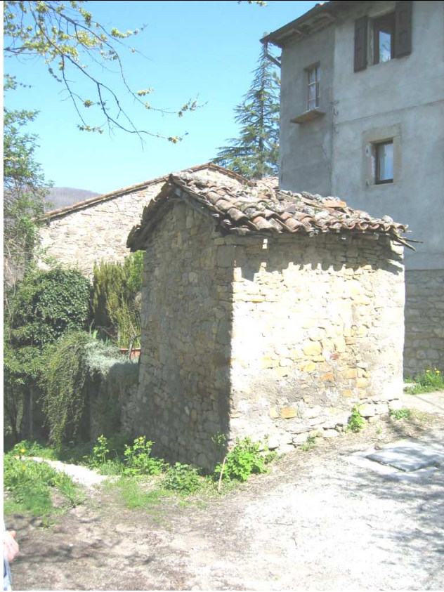
ZONA 1 Foto n. 87: Borgo di Monzone, "casa della maschera"